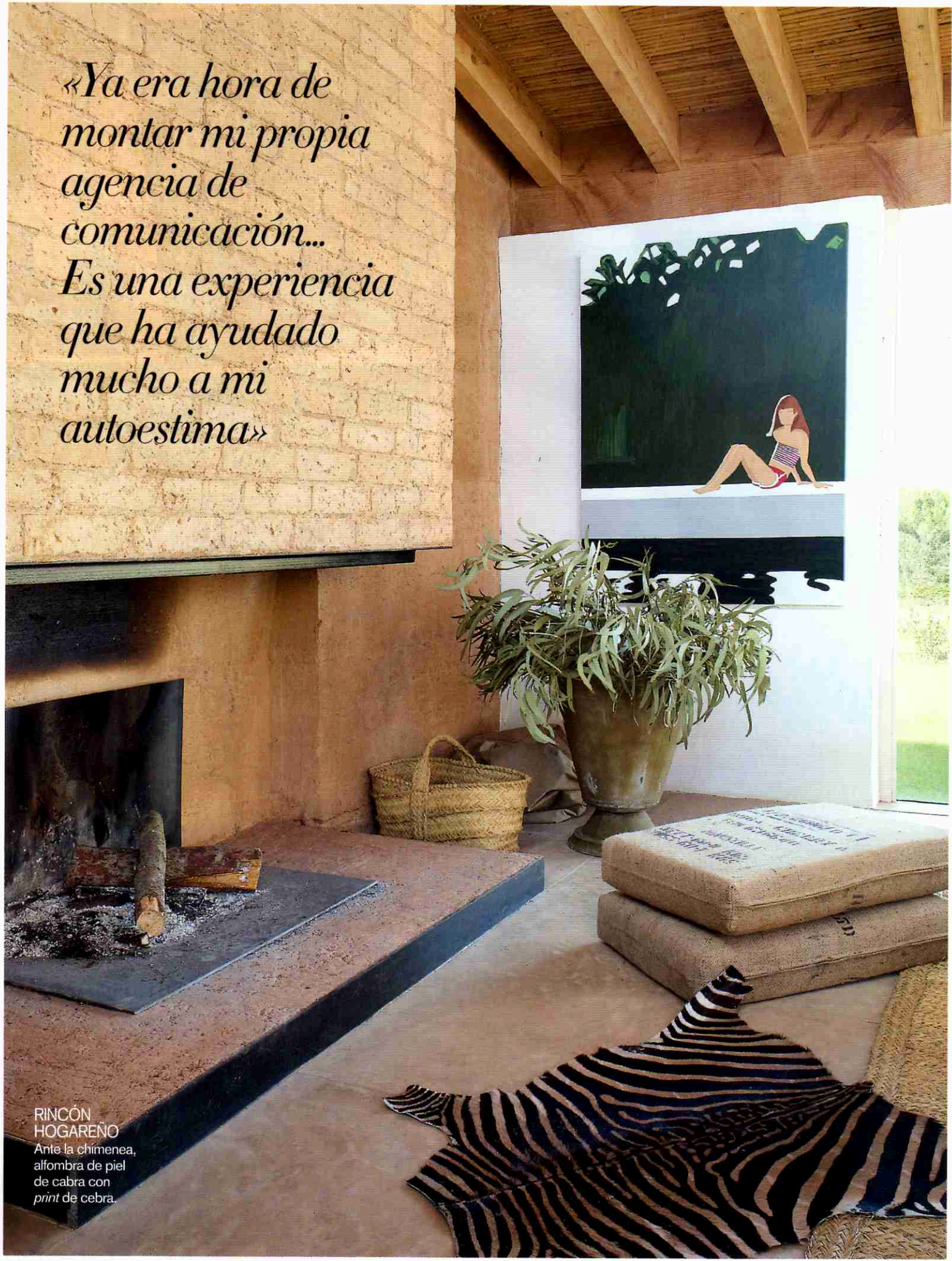
RINCÓN HOGAREÑO Ante la chimenea, alfombra de piel de cabra con print de cebra.

«Ya era hora de montar mi propia agencia de comunicación... Es una experiencia que ha ayudado mucho a mi autoestima»